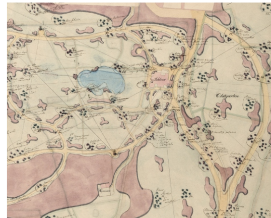
Eduard Petzold, Projekt parku pałacowego w Brzezince Średzkiej, 1887, Krajowy Urząd Ochrony Zabytków Saksonii