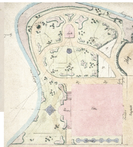
Eduard Petzold, Projekt ogrodu przy willi Schneidera w Legnicy, 1863, Krajowy Urząd Ochrony Zabytków Saksonii

Na terenie dzisiejszej Polski zachowało się około 70 założeń zaprojektowanych lub nadzorowanych przez Petzolda – w tym park pałacowy w Dobrej (1858), arboretum w Parku Mużakowskim (1858), a także parki pałacowe w Henrykowie (1863), Bożkowie (1864), Mrowinach (1870) i Stolcu (1872). Ponadto opracował projekt parku przy pałacu w Goczałkowie Górnym, a w 1880 r. przygotował zalecenia dotyczące kształtowania doliny rzeki Włodzicy na odcinku pomiędzy zamkiem Sarny a dolnym dworem we Włodowicach. W latach 1863–1886 prowadził w Bolesławcu szkółkę drzew i krzewów ozdobnych, która stanowiła istotny element jego warsztatu ogrodniczego.