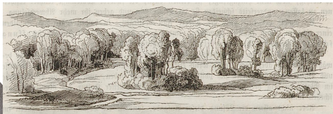
Kompozycja drzew z "Wkładu w ogrodnictwo krajobrazowe" Eduarda Petzolda, 1849