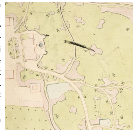
Eduard Petzold, Projekt parku pałacowego we Włostowie, 1864, Krajowy Urząd Ochrony Zabytków Saksonii

W swoich zaleceniach rekomendował m.in.: drzewa o kulistych koronach (lipa, buk) – w większych blokach, gatunki malownicze (dąb, buk) – w małych grupach lub jako solitery, drzewa smukłe (kasztanowiec zwyczajny, kasztanowiec czerwony) – w alejach, o luźnych lub wydłużonych koronach (modrzew, grab, wiąz, tulipanowiec, orzech, skrzydłorzec) – w grupach, formy płaczące – przy wodzie, na łąkach lub w pobliżu ruin. Petzold dbał o to, by obrzeża grup i kęp tworzyły gatunki jasnozielone (np. lipa krymska, grab), kontrastujące z ciemnym wnętrzem masywu. Zalecał też sadzenie kilku siewek blisko siebie, by nadać drzewom wygląd krzewów i wzmocnić efekt naturalności.