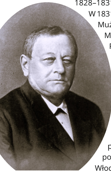
Eduard Petzold, ok. 1890