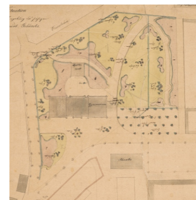
Eduard Petzold, Projekt ogrodu przy dawnym Gimnazjum w Bolesławcu (ob. sąd rejonowy), 1865, Krajowy Urząd Ochrony Zabytków Saksonii

Ważnym elementem jego stylu było kształtowanie sieci osi widokowych, często wyprowadzanych z tarasu pałacowego ku odległym wzniesieniom lub innym charakterystycznym punktom w krajobrazie. Granice założeń ukrywał w gęstych nasadzeniach, aby optycznie powiększyć park i zintegrować go z otoczeniem. Ścieżki obwodowe pełniły rolę „galerii widokowej” – ich zakręty i otwarcia kadrowały perspektywy na solitery, grupy drzew i panoramy. Dzięki tak przemyślanemu podejściu, Petzold nie tylko harmonizował park z krajobrazem, lecz także podnosił walory estetyczne całego otoczenia, stając się jednym z prekursorów ochrony krajobrazu w nowoczesnym rozumieniu.