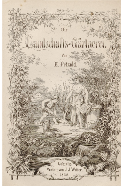
Okladka "Ogrodnictwa krajobrazowego" Eduarda Petzolda, 1862

Petzold był również płodnym teoretykiem – autorem około 10 książek i kilkudziesięciu artykułów poświęconych sztuce ogrodowej. Do jego najważniejszych dzieł należą m.in. „O teorii kolorów w krajobrazie” (Zur Farbenlehre der Landschaft, 1853), „Ogrodnictwo krajobrazowe” (Die Landschafts-Gärtneri, 1862) i „Arboretum Muscaviense” (1864). W 1874 r. opublikował biografię i analizę twórczości swojego mistrza księcia Hermanna von Pückler-Muskau, która została przetłumaczona na język polski przez Fundację im. Eduarda Petzolda w 2024 r. Jego twórczość teoretyczna i praktyczna uczyniła go kluczowym przedstawicielem „mużakowskiej szkoły ogrodniczej” oraz jednym z czołowych teoretyków ogrodnictwa europejskiego XIX wieku.