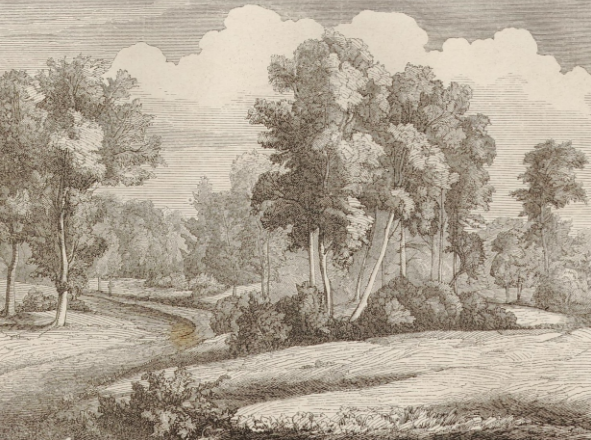
Widok na park w Bad Muskau w "Ogrodnictwie krajobrazowym" Eduarda Petzolda, 1862

Niniejsza ulotka powstała w ramach realizacji projektu „Lubniewicka galeria osobowości – Eduard Petzold”, którego celem było odkrywanie ważnych dla Lubniewic faktów i postaci historycznych.